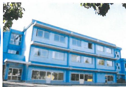
Scuola secondaria di Gattico Viale del Borgarino 12 ore 11:00