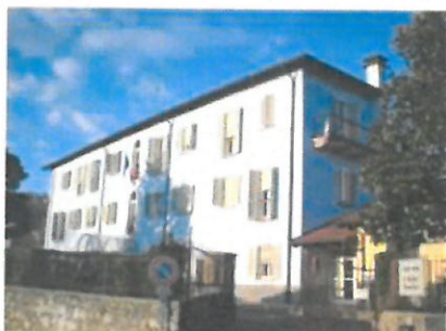
Scuola secondaria di Dormelletto Via Tesio 5 ore 09:00

La Dirigente Scolastica e i Docenti presentano l'offerta formativa dell'Istituto